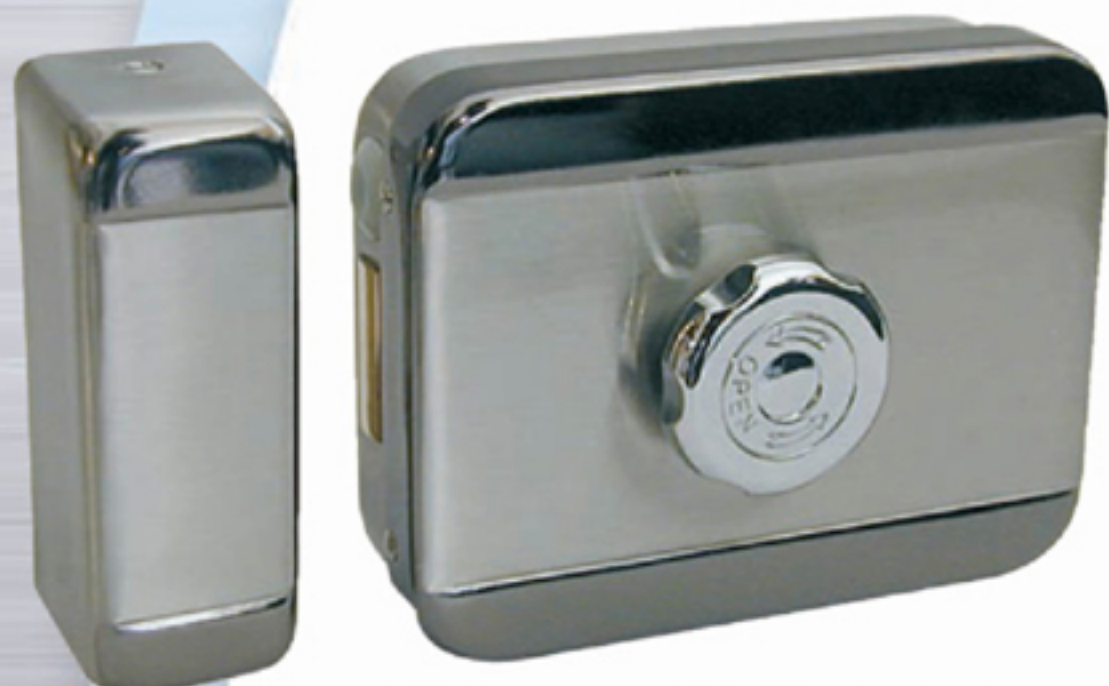
Référence BEUGNOT: 7042