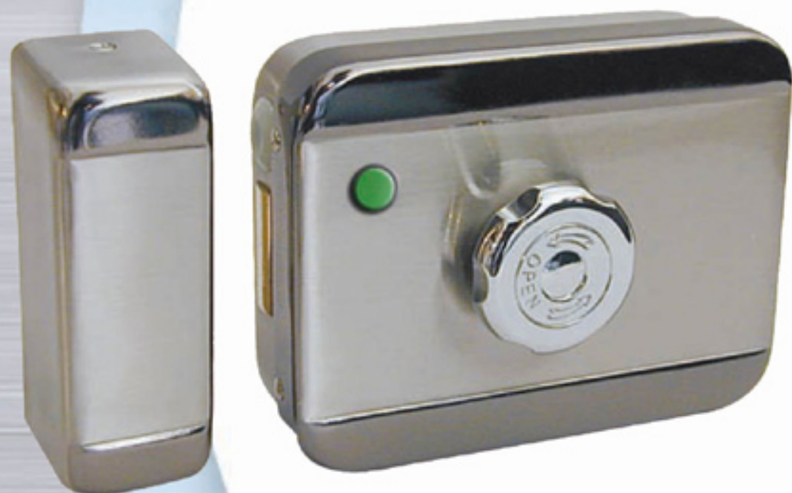
Référence BEUGNOT: 7041