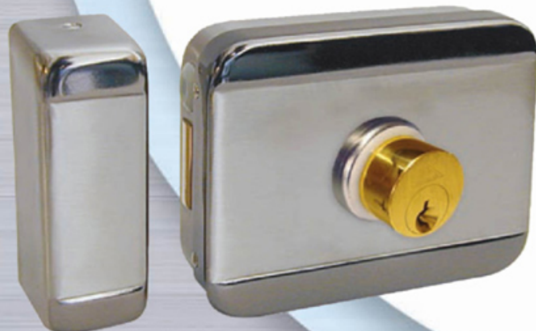
Référence BEUGNOT: 7043