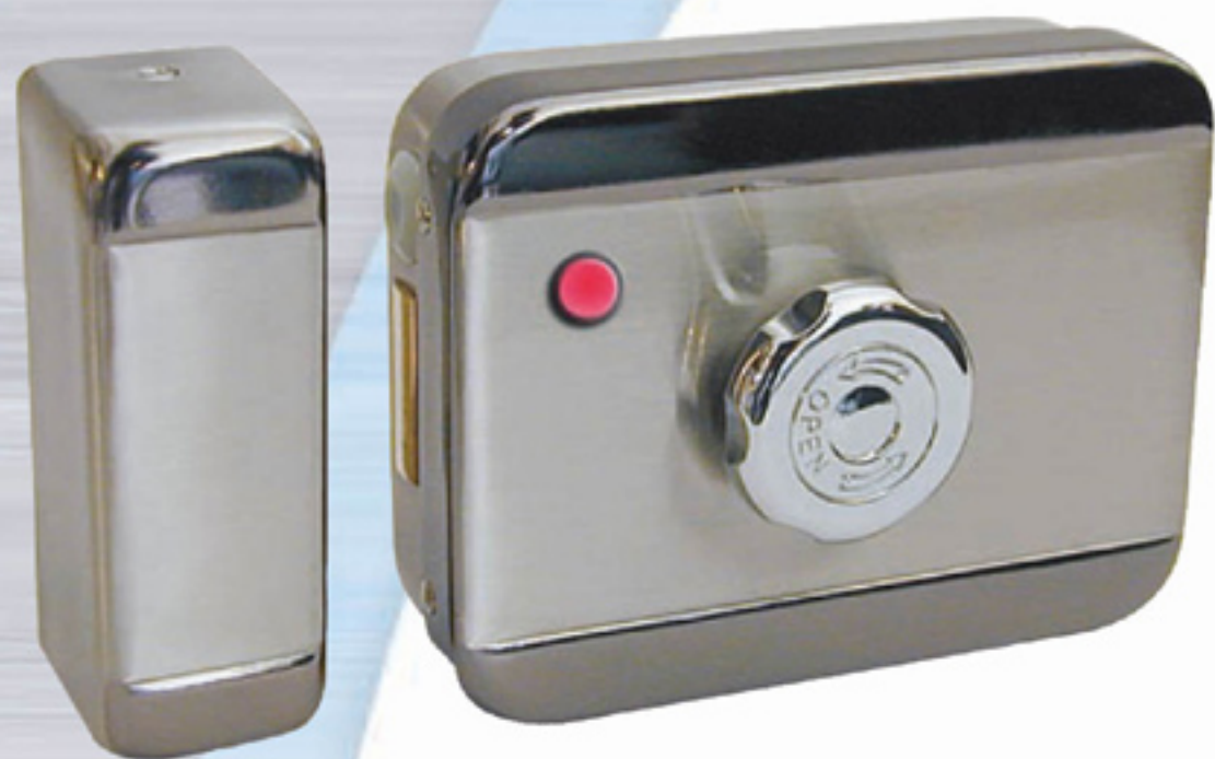
Référence BEUGNOT: 7040

La serrure peut être ouverte de l'extérieur par un contrôle d'accès classique (bouton, clavier, interphone, etc.) ou par la clé. Elle peut être ouverte de l'intérieur par un bouton poussoir indépendant ou par le bouton rouge ou mécaniquement par le bouton chromé.